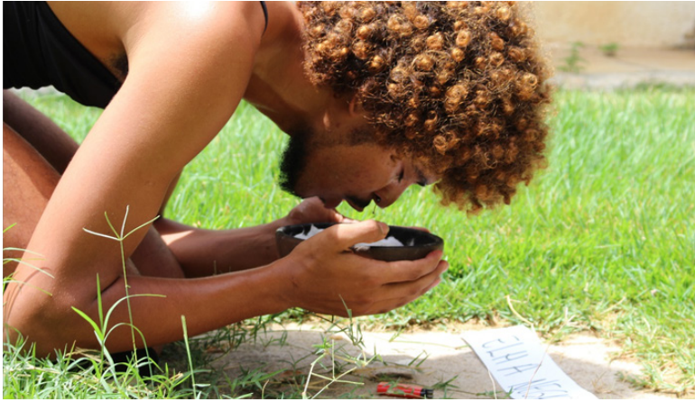
Foto 6: Preparação para queimar os preconceitos