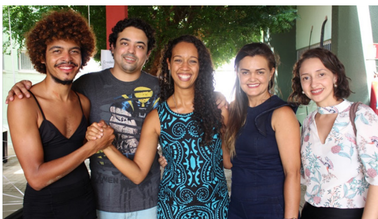
Foto 49: Organizadores/as e Colaboradores/as do Evento