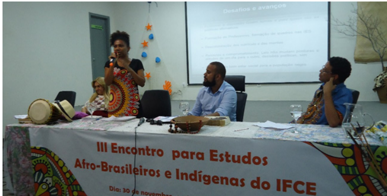
Foto 11: Exposição Maria Carolina Costa - UNILAB