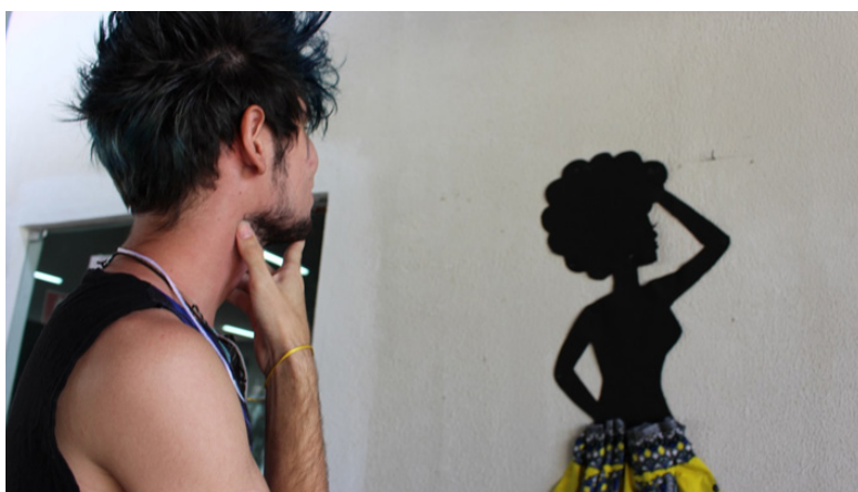
Foto 45: Olhar Sobre a Representação da Mulher Negra