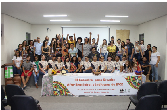
Foto 18: Encerramento dos trabalhos da Mesa Redonda