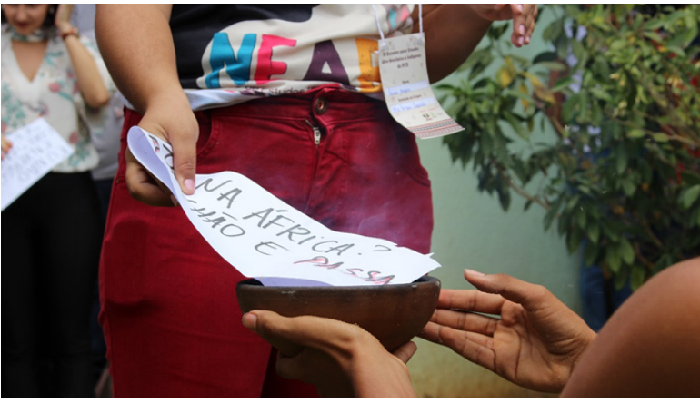
Foto 7: Entrega de discurso para ser queimado