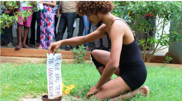
Foto 8: “Queimando” os discursos preconceituosos