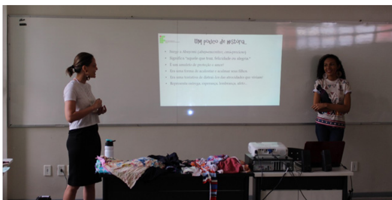
Foto 29: História de surgimentos das bonecas

Após a explicação das etapas de produção das bonecas Abayomi, a professora pediu aos participantes que colocassem as bonecas deitadas no chão, e que os mesmos também deitassem junto às suas bonecas. Ao final da Oficina, todos os participantes obtiveram conhecimento da valorização e da importância da cultura afro-brasileira, através da produção e confecção das bonecas, as quais foram levadas para casa pelos participantes. Para registrar o momento e finalizá-lo, foi realizada a fotografia em grupo.