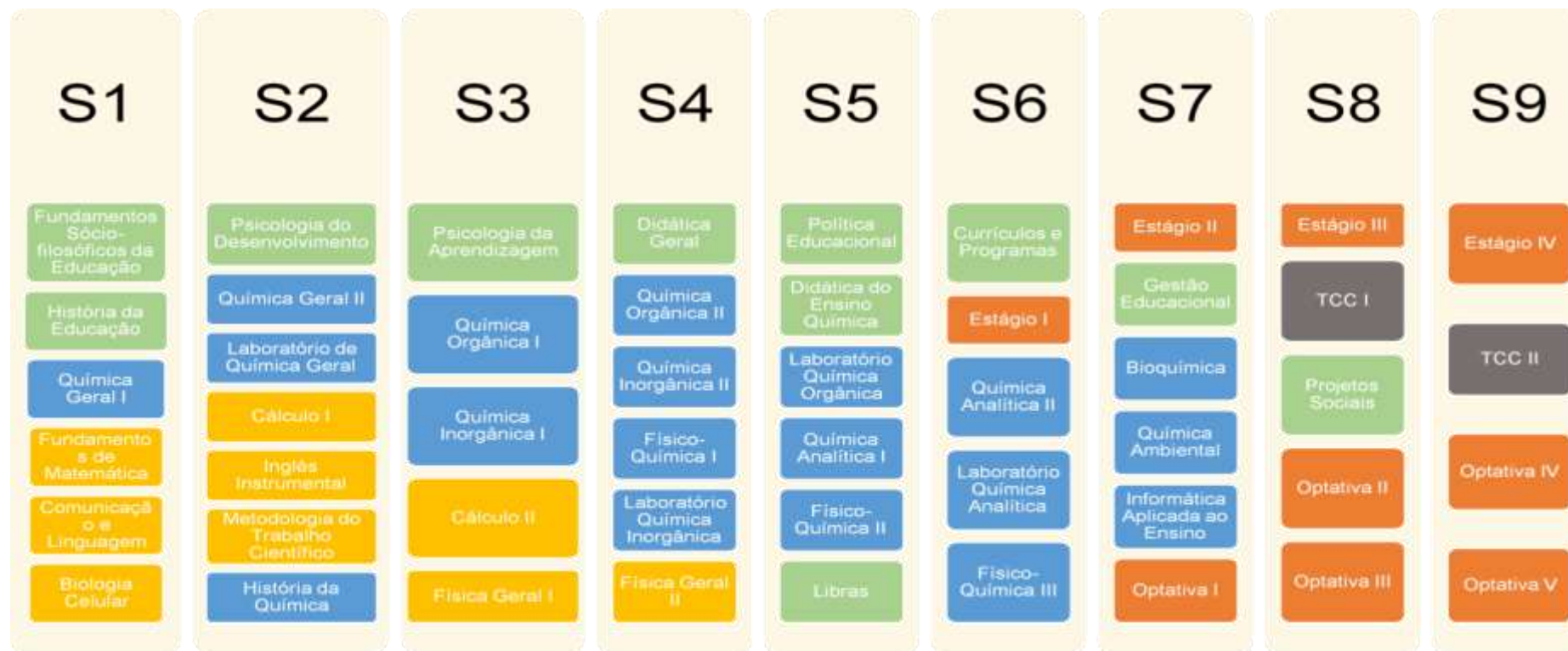
Figura 2. Estrutura curricular das componentes curriculares de natureza específica, básica e didático-pedagógica bem como Estágio e disciplinas optativas.