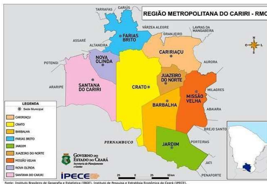
Figura 2: Região Metropolitana do Cariri.