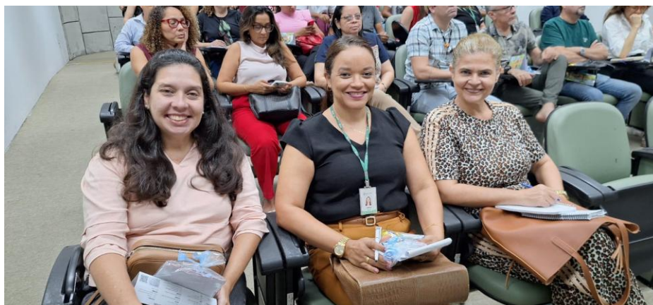
Figura 2a – Encontro Pedagógico do IFCE campus Fortaleza, semestre 2025.1