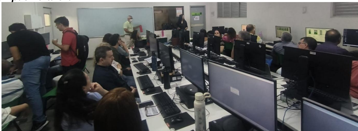
Figura 20 – Treinamento com a Coordenadoria de Gestão do Sistema Acadêmico no campus Fortaleza