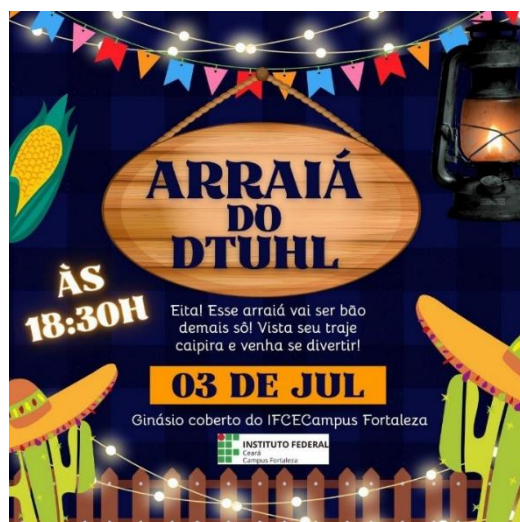
Figura 10a – Card de divulgação do Arraiá do DTUHL na Semana de Eventos do DTUHL – 2025.1