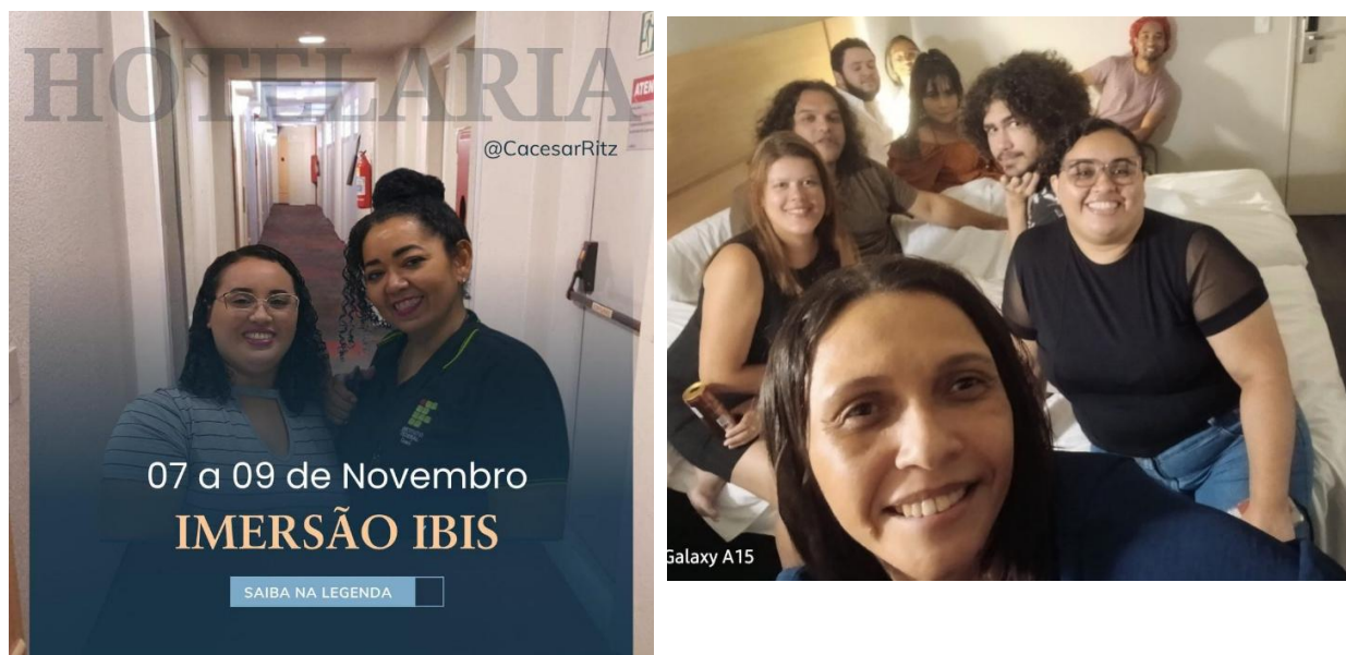
Figura 21 – Alunos do curso de Tecnologia em Hotelaria, campus Fortaleza na ação Hóspede por 1 dia no Hotel Ibis Praia de Iracema

proporcionando ao aluno a vivência como hóspede num conceituado meio de hospedagem. A ação ocorreu entre os dias 07 a 09 de novembro de 2025 com check in : 07-11-2025 e check out : 09-11-2025, com café da manhã incluído na diária.