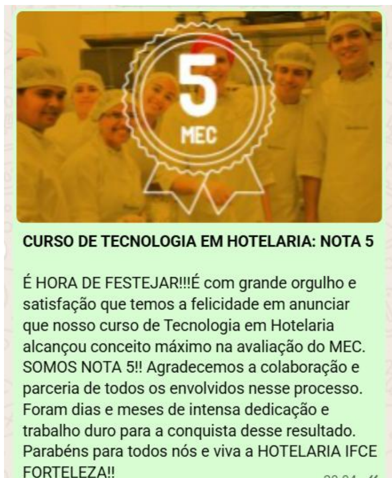
Figura 1 – Card de divulgação da Nota 5 recebida no processo de renovação do reconhecimento do curso de Tecnologia em Hotelaria junto ao MEC