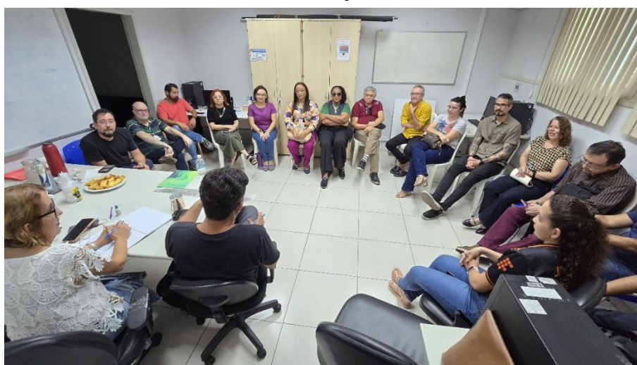
Figura 19 – Reunião com o NAPNE, Campus Fortaleza