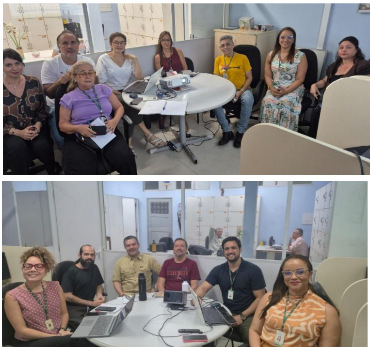
Figura 3 - Reunião de alinhamento de disciplinas com professores do curso de Hotelaria