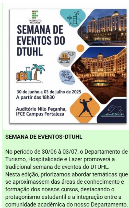
Figura 7 – Card de divulgação da Semana de Eventos do DTUHL - 2025.1