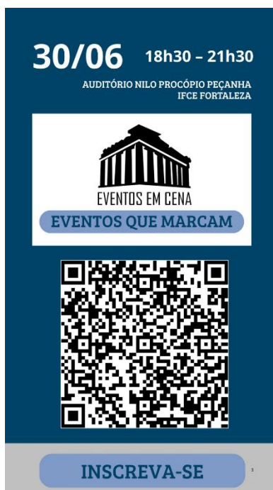
Figura 8 – Card de divulgação do Eventos em Cena da Semana de Eventos do DTUHL - 2025.1