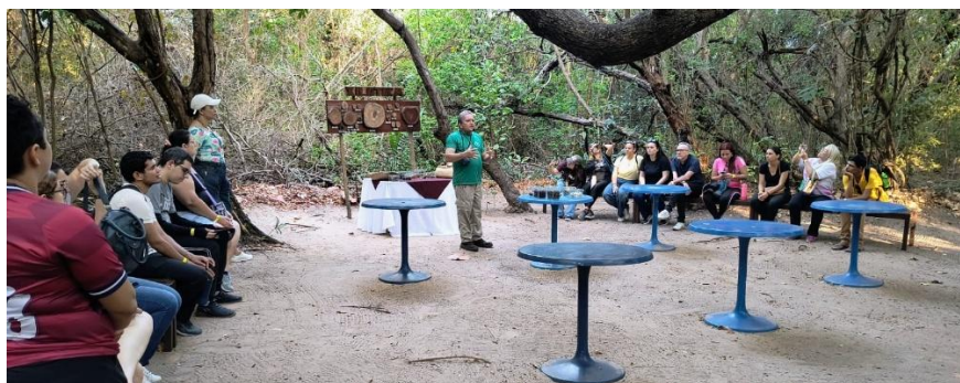
Figura 13– Visita Técnica ao SESC Iparana, Semana de Eventos do DTUHL, 2025.2