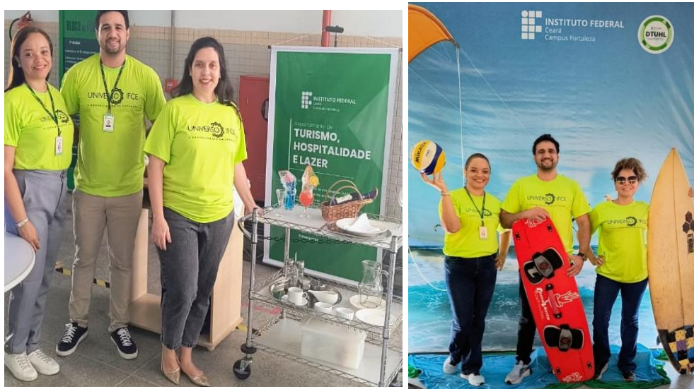
Figura 18 – Universo IFCE, Campus Fortaleza

melhoria contínua da qualidade acadêmica junto aos alunos do curso de Tecnologia de Hotelaria do IFCE.