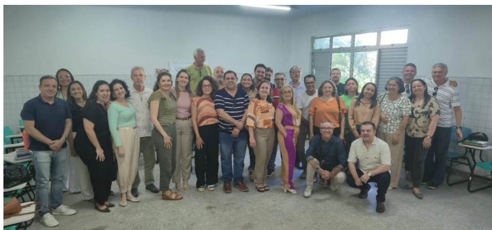
Figura 2b – Encontro Pedagógico do IFCE campus Fortaleza, semestre 2025.1