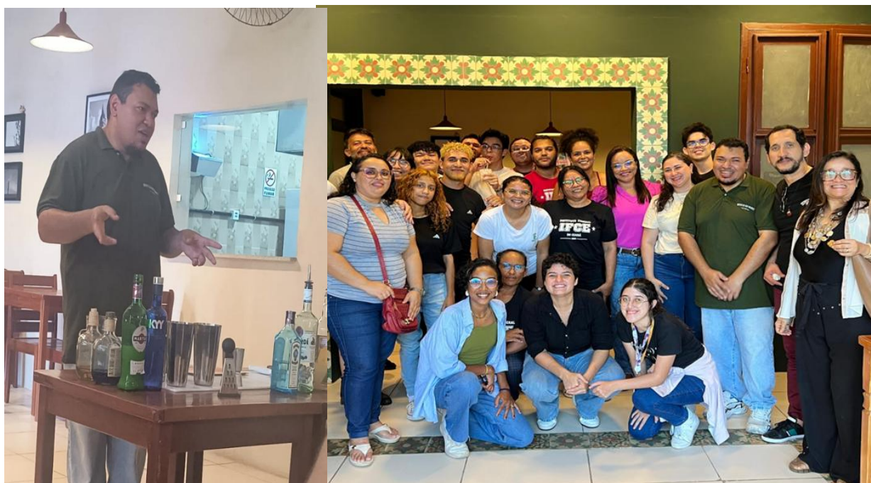
Figura 6 – Visita técnica ao Boteco do Murici em Fortaleza, CE

Alimentos e Bebidas (A&B), Processos de Coquetelaria e Princípios e Práticas de Alimentos e bebidas. Com o objetivo de proporcionar aos estudantes do curso de Tecnologia em Hotelaria uma vivência prática e aprofundada dos conhecimentos abordados em sala de aula, a oportunidade de observar boas práticas operacionais em bares, como organização do mise en place , padronização de receitas, controle de estoque, planejamentos de cardápios, atendimento ao cliente, mixologia clássica e contemporânea, além de aspectos relacionados à gestão de equipes, controle de custos e experiência do consumidor, elementos que contribuem para a formação de profissionais capazes de atuar de forma estratégica e operacional em estabelecimentos de hospedagem, alimentação e entretenimento.