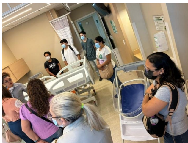
Figura 5 – Visita ao Hospital Unimed Sul em Fortaleza, CE

Os discentes tiveram a oportunidade de visitar a parte de Hotelaria Hospitalar e o setor de qualidade com relação à disciplina de gestão da Qualidade ( Figura 5) no Hospital da Unimed Sul. Foram realizadas visitas técnicas ao Hotel Ibis Praia de Iracema com o objetivo de aplicar os conhecimentos adquiridos em sala de aula, realizar check list , visitar as áreas de governança, setor de A&B verificando se o equipamento encontra-se adequado às normas regulamentadoras e utilização de EPI”S nas atividades relacionadas à disciplina de Gestão de Hospedagem.