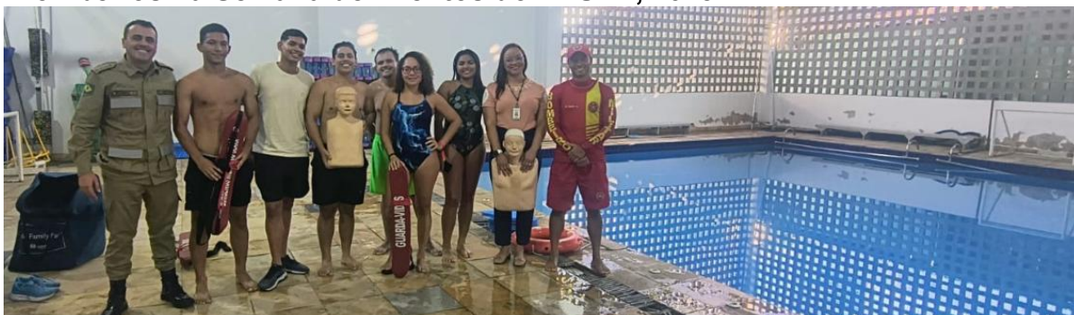
Figura 16 - Oficina de Prevenção de Acidentes e Salvamento Aquático, com Corpo de Bombeiros na Semana de Eventos do DTUHL, 2025.2