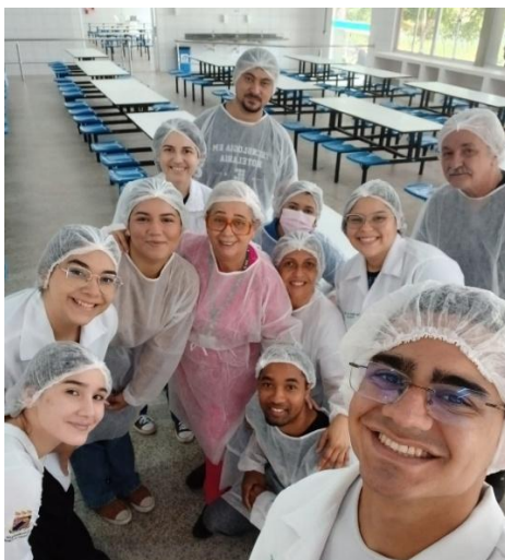
Figura 4 – Visita ao Restaurante Universitário da UECE