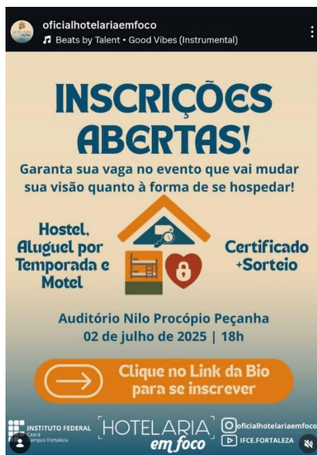
Figura 9 –Card de divulgação do Hotelaria em Foco da Semana de Eventos do DTUHL - 2025.1