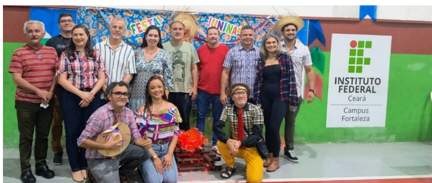
Figura 10b – Professores do curso participando do Arraiá do DTUHL na Semana de Eventos do DTUHL – 2025.1