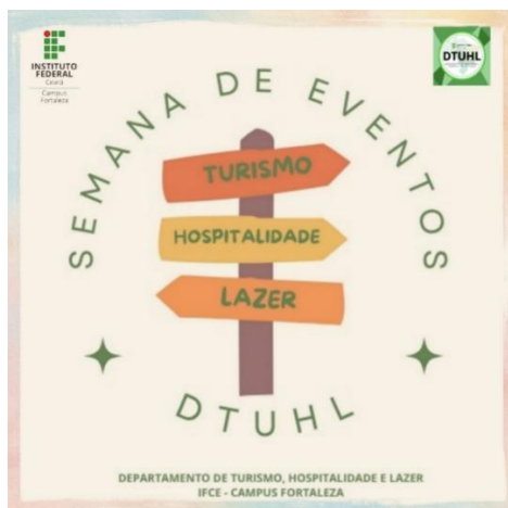
Figura 11 - Card de divulgação da Semana de Eventos do DTUHL - 2025.2