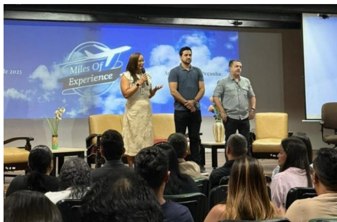
Figura 14– Participação da coordenação do curso de Tecnologia em Hotelaria na mesa de abertura do Evento Miles of experience