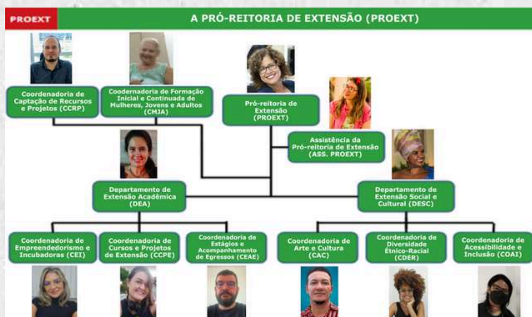
Figura 1 – Organograma da PROEXT/IFCE

A Pró-Reitoria de Extensão do IFCE, conforme ilustrado na Figura 1 , está organizada estrategicamente para contemplar suas múltiplas dimensões de atuação junto às comunidades atendidas pela instituição. Sua estrutura busca promover o desenvolvimento tecnológico e social; a defesa dos direitos humanos e da justiça; a inserção profissional por meio de estágios, empregabilidade e acompanhamento de egressos; o fomento às atividades culturais e artísticas; o fortalecimento da economia popular e solidária; bem como o incentivo ao empreendedorismo, à educação empreendedora e à inovação.