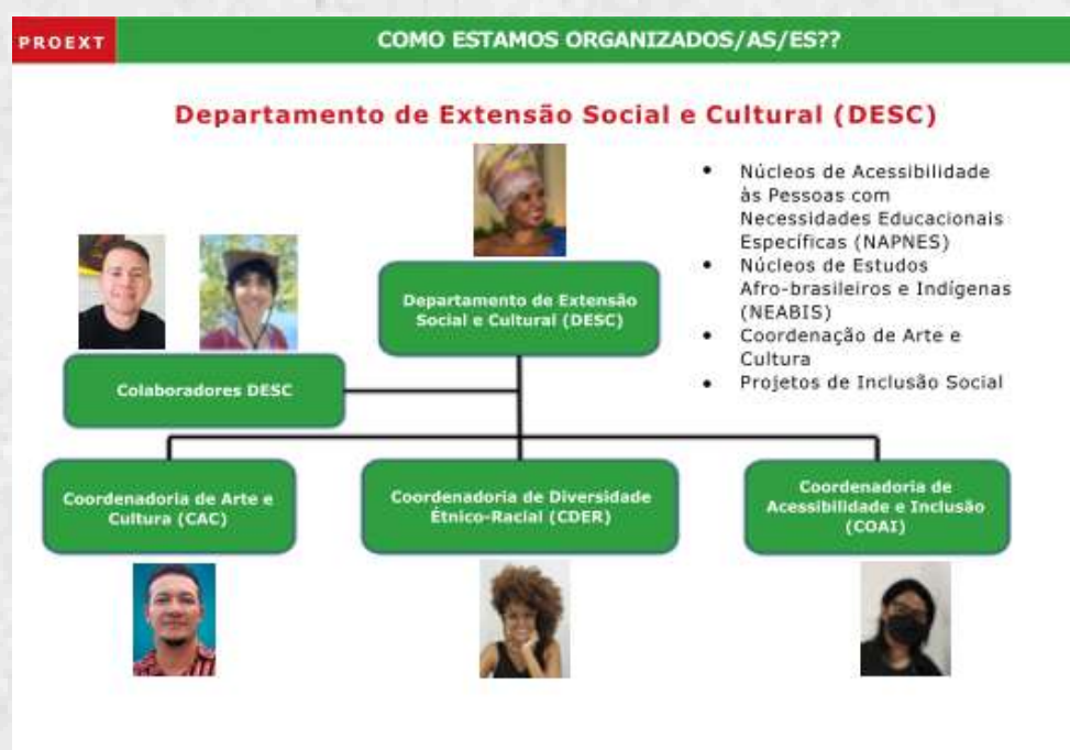
Figura 3 – Organograma do DESC/PROEXT

O organograma do DESC está demonstrado na Figura 3 .