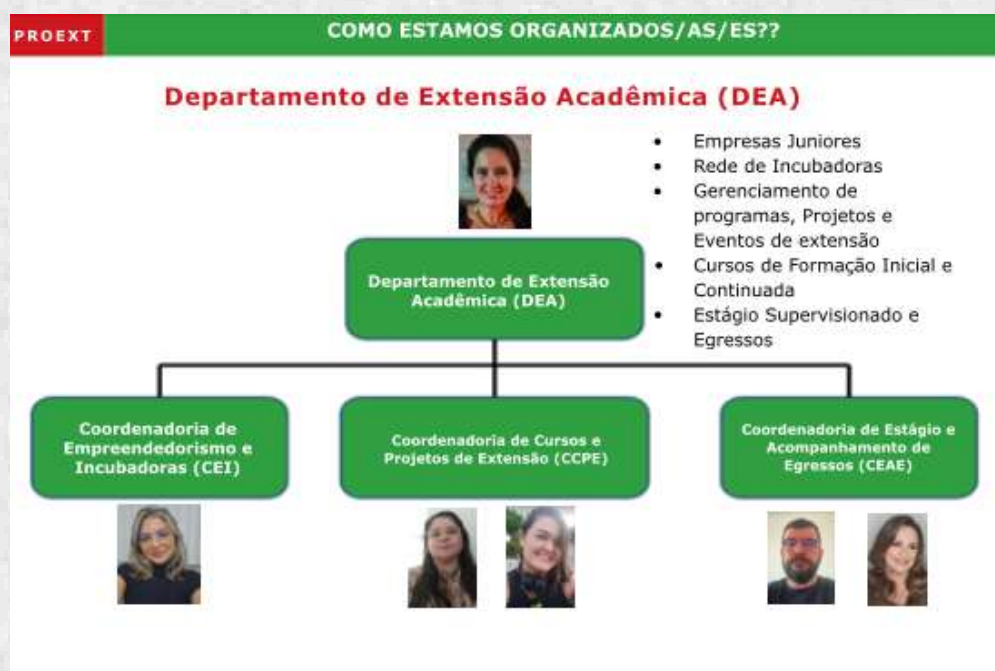
Figura 2 – Organograma do DEA/PROEXT

O organograma do DEA está demonstrado na Figura 2 .