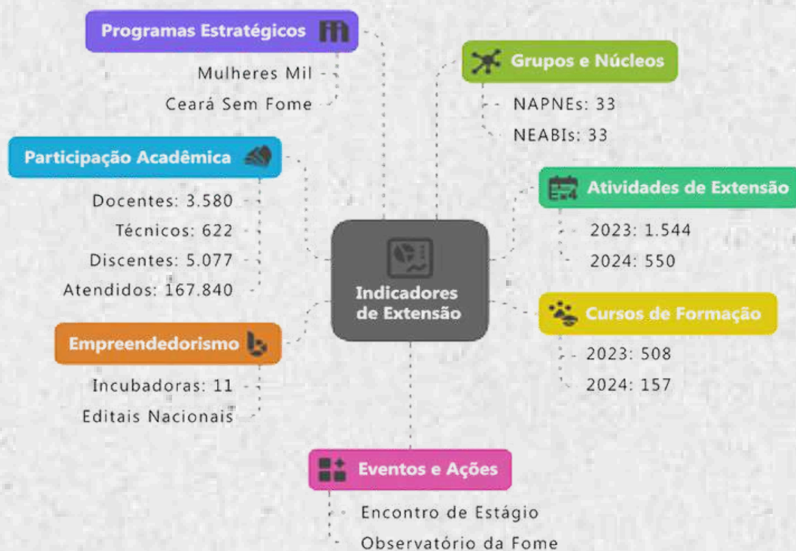
Figura 5 - Indicadores de extensão e engajamento acadêmico

Apesar desse contexto, a PROEXT manteve o compromisso com a oferta de iniciativas relevantes, garantindo a continuidade de projetos estratégicos e parcerias significativas.