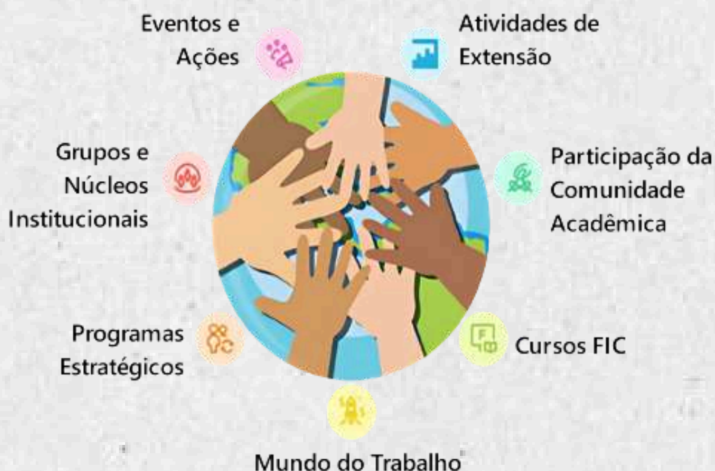
Figura 4 - Visão geral das iniciativas de Extensão

A Figura 4 apresenta uma visão geral das iniciativas de extensão, permitindo compreender o papel estratégico dessa área no fortalecimento do vínculo entre o Instituto e as comunidades atendidas.