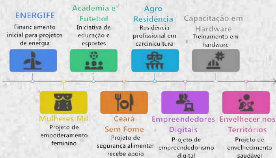
Figura 6 - Projetos executados mediante financiamento descentralizado

No tocante aos Termos de Execução Descentralizada (TEDs): Investimentos e Impactos na Extensão do IFCE (2023–2024), a Pró-Reitoria de Extensão (PROEXT) do IFCE, seja através do protagonismo dos campi ou da Pró-reitoria, vem se destacando pela robustez e diversidade das parcerias firmadas por meio de Termos de Execução Descentralizada (TEDs), mecanismo que possibilita o repasse de recursos entre órgãos públicos para a execução de ações estratégicas, conforme Figura 6 .