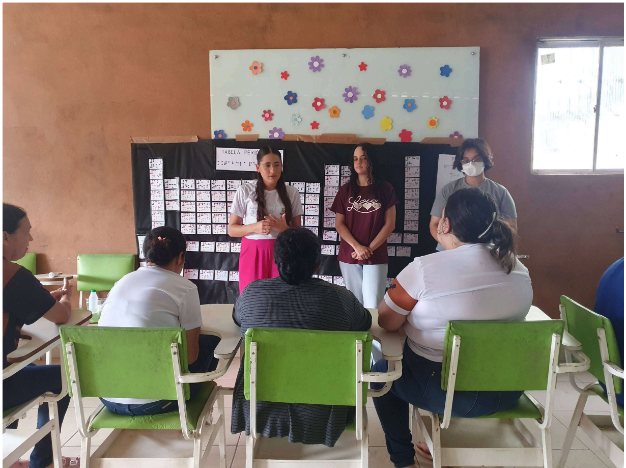
Figura 9: Registro da apresentação do Mapeamento Situacional de Acessibilidade do IFCE campus Ubajara, realizado no dia 11 de fevereiro de 2025.