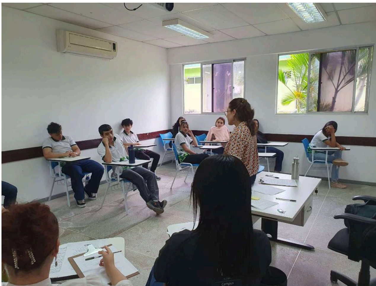
Figura 3: Registro de uma das reuniões do Napne no semestre de 2025.1.