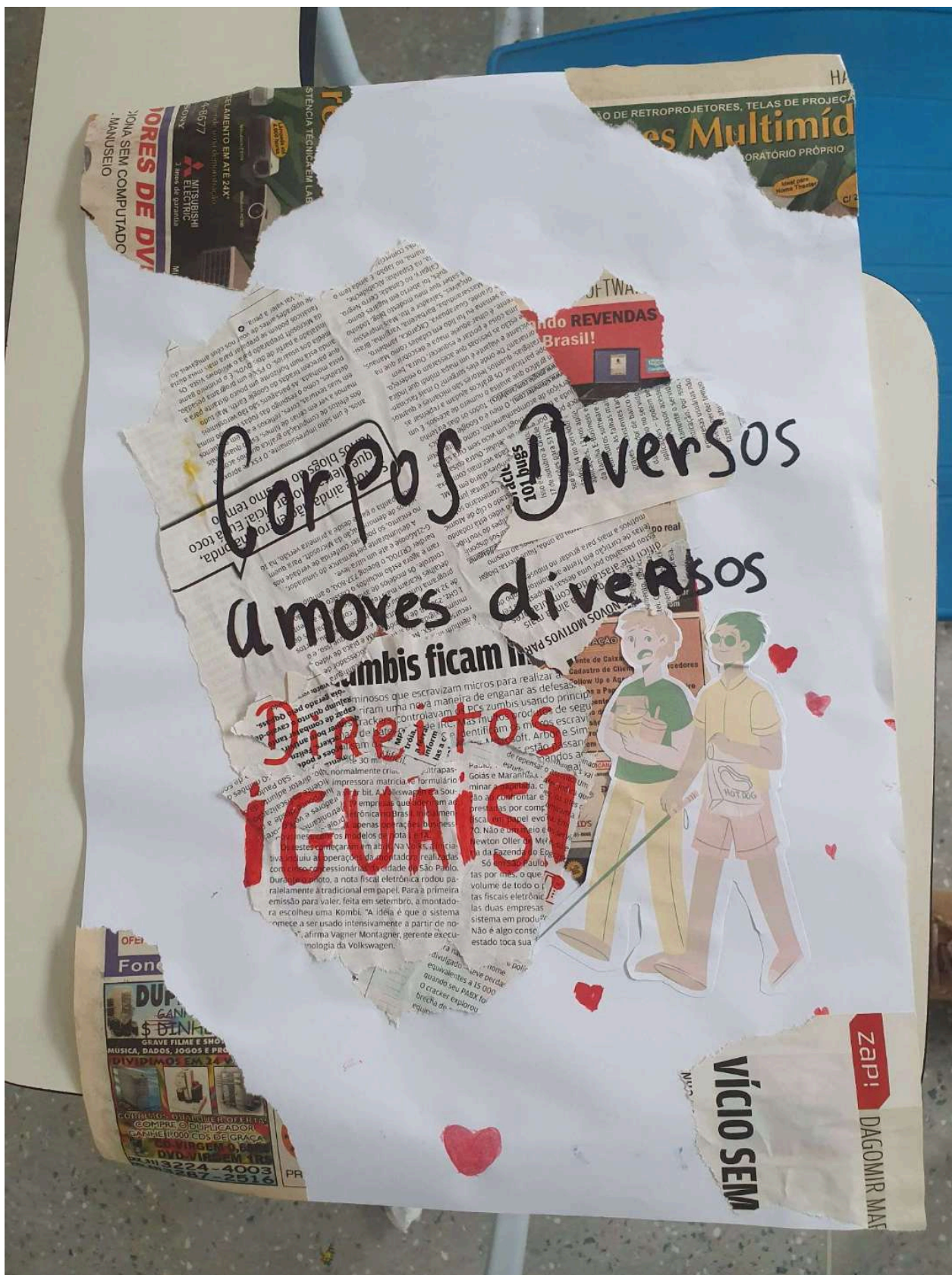
Figura 6: Cartaz de divulgação do Grupo de Estudo de Acessibilidade e Inclusão realizado em 8 de abril de 2025.