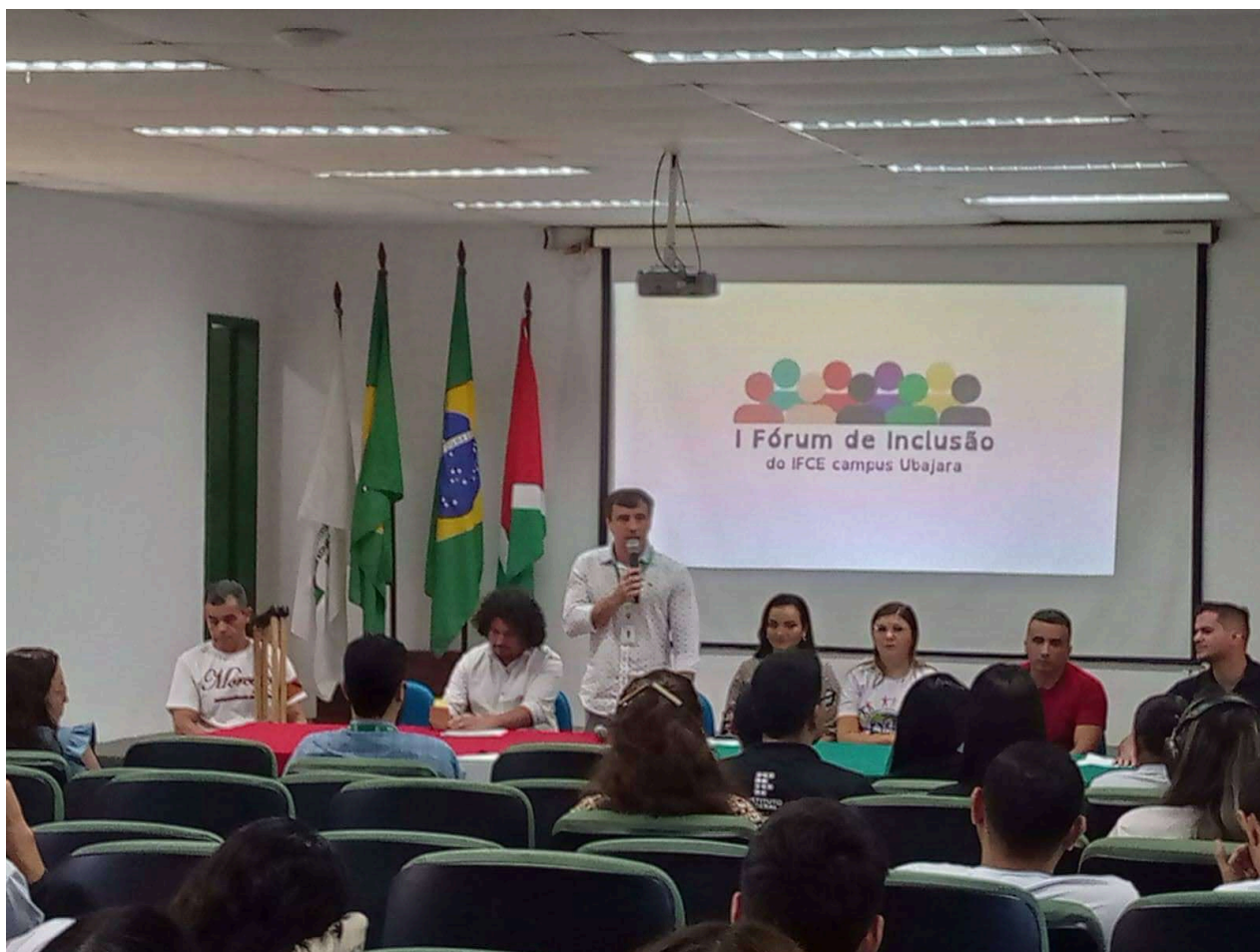
Figura 2: Registro do Grupo de Trabalho sobre Bullying do I Fórum de Inclusão do IFCE campus Ubajara, ocorrido em 21 de maio de 2025.