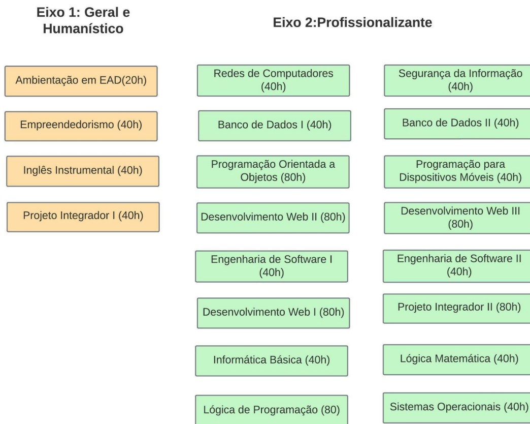
Figura 02 - Eixos de competências